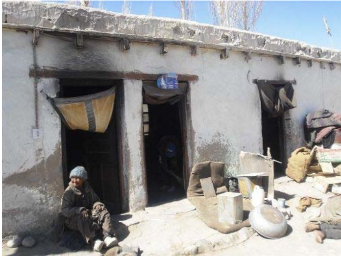
Desaströser Zustand des Altbaus

notwendig, um den alten Tibeterinnen und Tibetern ein Dach über dem Kopf zu errichten bevor der extrem strenge Winter wieder beginnt.