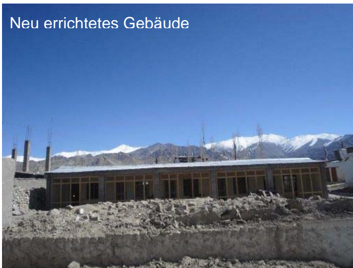
Neu errichtetes Gebäude

Errichtungskosten während der letzten Jahre enorm gestiegen. Wir haben erfahren, dass durch die große Flutkatastrophe im August 2010 die Lohnkosten für Bauarbeiter unverhältnismäßig in die Höhe getrieben wurden, der Preis für Ziegel verdreifachte sich. Nun ist der Bau zu 75 Prozent fertig, doch die überschießenden Ausgaben liegen weit über dem vorhandenen Budget. Geplant war eine Fertigstellung im heurigen Oktober.