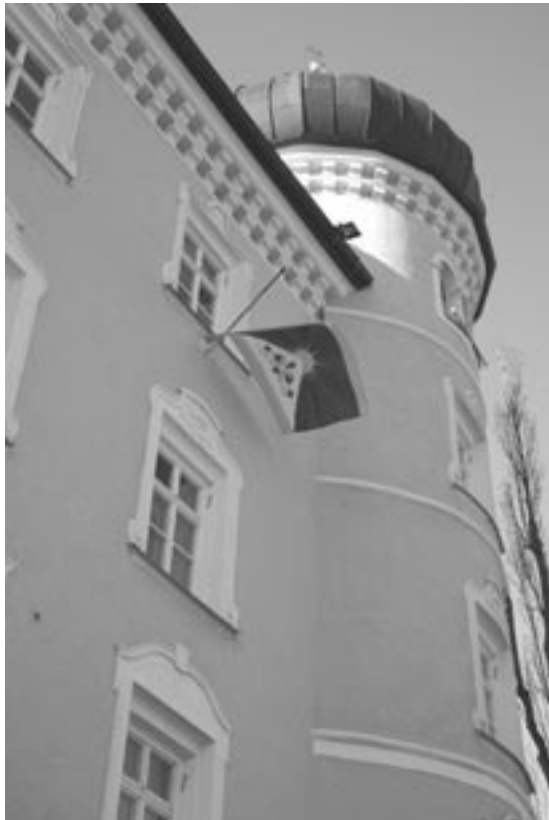
Flagge in Liebenau

571, in Frankreich 400, in Luxemburg 25 und in der Schweiz 20. Außerdem machten noch viele andere Dörfer, Kleinstädte und Städte in Europa mit. Ein weiterer Aspekt der Kampagne betrifft die 400 Gemeinden in ganze Europa, welche die tibetische Flagge permanent zur Schau stellen – und zwar so lange, bis das tibetische Volk die echte Autonomie in seinem Heimatland erlangt. Beteiligt daran sind 206 Stadtgemeinden in Italien, 154 in Deutschland, 18 in Ungarn, 12 in Belgien, 4 in Spanien, 3 in Albanien, 2 in der Schweiz und 1 in Kroatien.