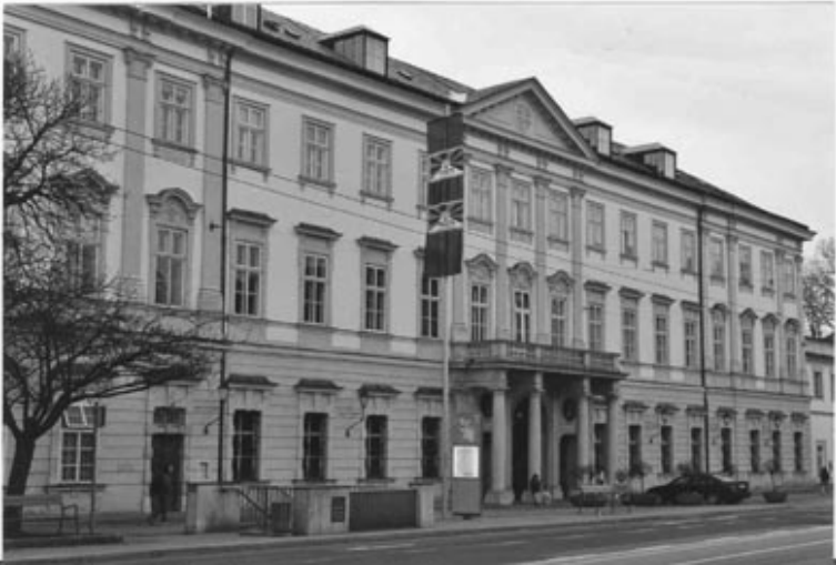
Flagge in Salzburg

Einige der Städten und Gemeinden in Österreich die es abgelehnt haben die Fahne Tibets zu hissen: